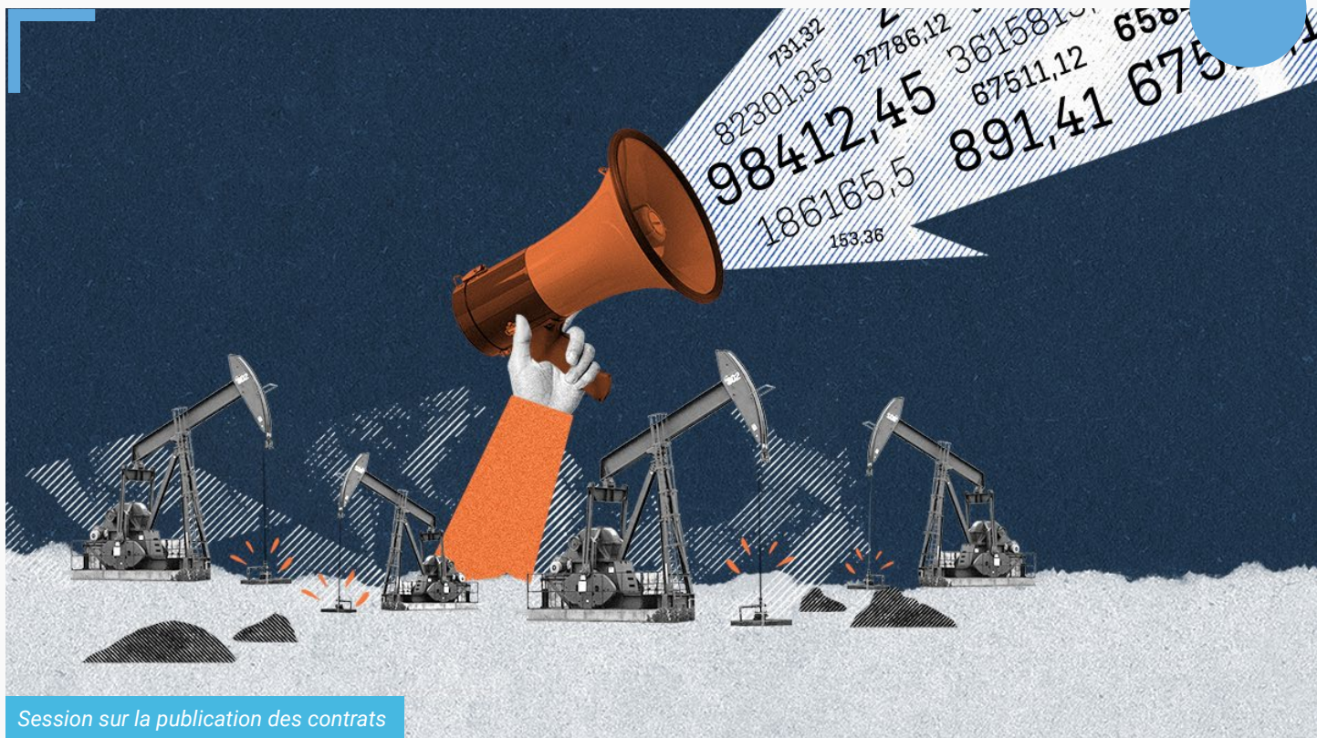
Session sur la publication des contrats

Le principal objectif de notre campagne #DiscloseTheDeal est d'augmenter le nombre de pays divulguant leurs contrats. La norme de l'ITIE exige la transparence des contrats depuis un an et il est temps de vérifier la mise en œuvre de cette exigence dans les faits. Lors de cette séance, différentes parties prenantes partageront leurs expériences, ce qui permettra de discuter d'une stratégie sur comment faire avancer collectivement la divulgation des contrats.