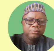
Monday Osasah Región anglófona de África