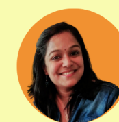
Сасвати Светлена Азиатско-Тихоокеанский регион