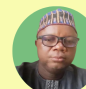
Мандей Осаса Англоязычная Африка