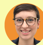
Карли Обот Европа и Северная Америка